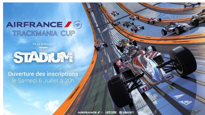
Trackmania 2 Stadium